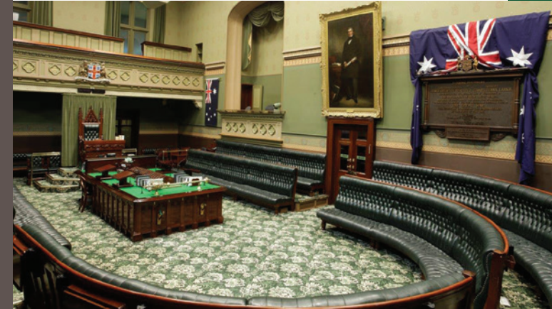
قاعة الجمعية التشريعية