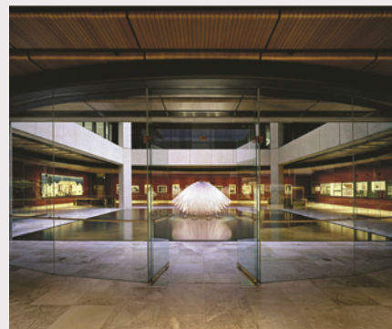
喷泉苑(The Fountain Court)

喷泉苑以Robert Woodward设计的中央水雕塑为特色。在议会大厦的周围，时不时会举行面向公众的历史文物展和艺术展。